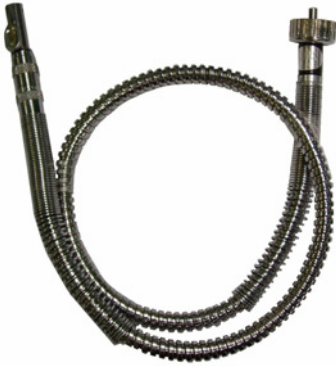
SPIRAL KOL 860.53.001 5mm.,Metal Kırlıflı