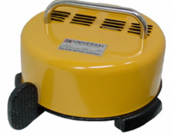
PEDAL (Hız Kontrol Ünitesi) 820.53.001 Metal Gövde