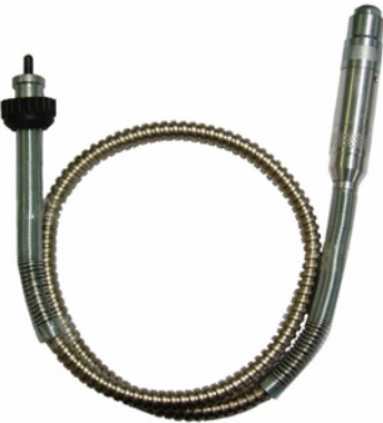
KALIPÇI SPIRAL KOL 860.53.101 Piyasemenli 3 Pens, 2.35-3-6mm. Metal Kırlıflı