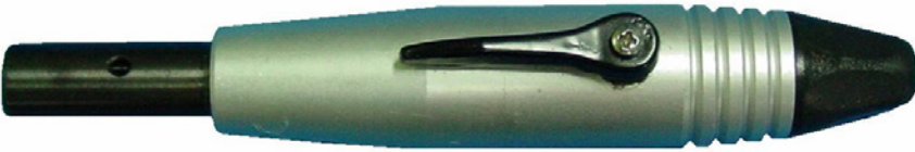
PİYASEMEN 860.54.651 Pens, 2,35mm.