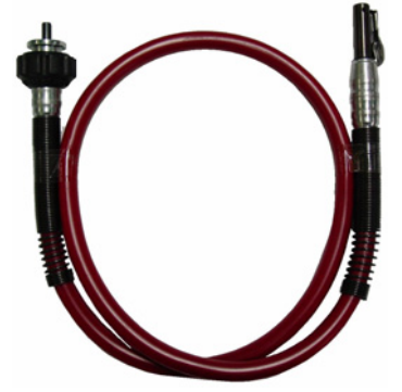
SPIRAL KOL 860.53.002 5mm.,Plastik Kırlıflı